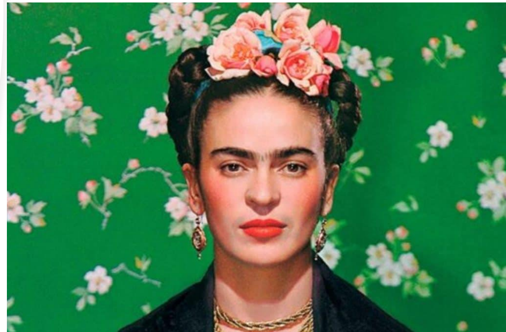
Frida Kahlo – artista mexicana